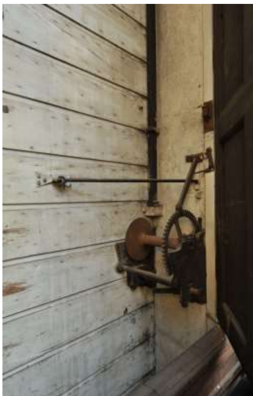
Treuil de la porte-fenêtre, mur est