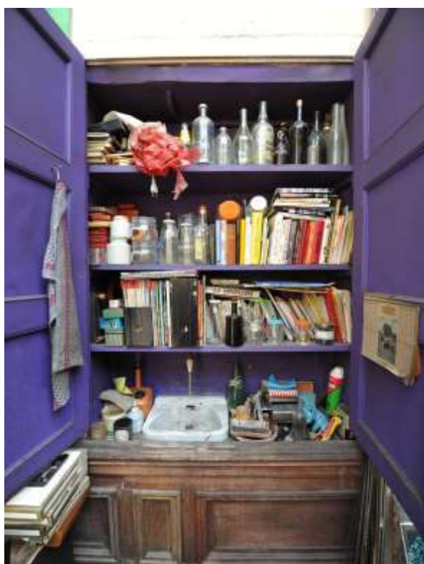
Lavabo, mur est