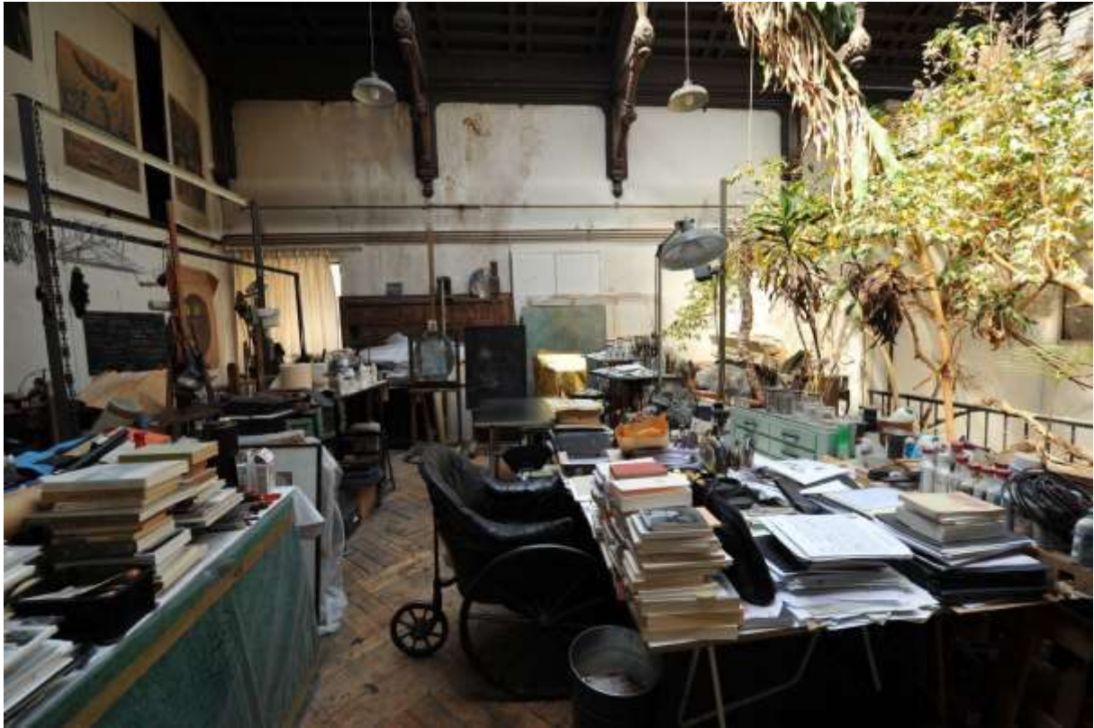
L'Atelier - mur ouest