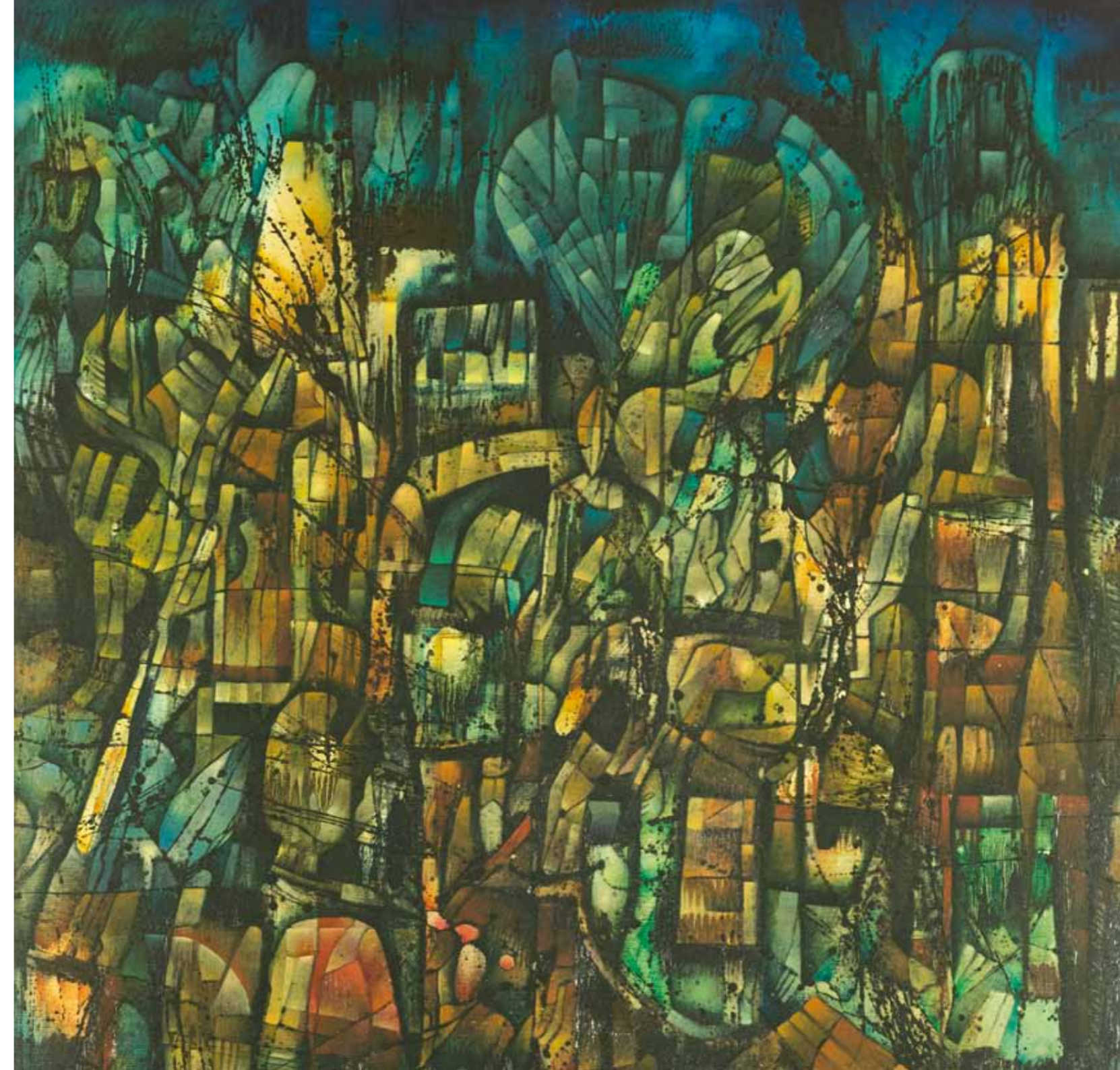
Jacques Lacomblez, Le grand jardin accouré à la nuit, 1961