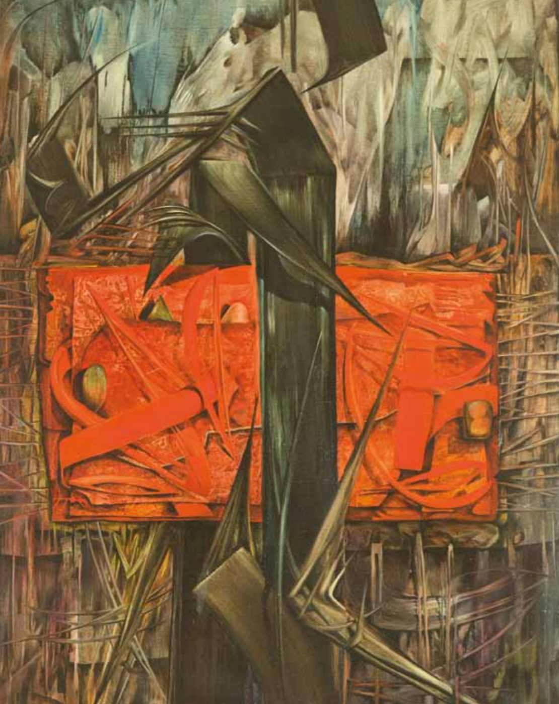
Jacques Zimmermann, Lettre à un passager, 1962